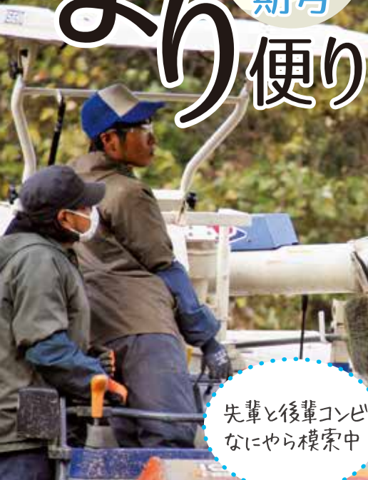
先輩と後輩コンビ なにやら模索中