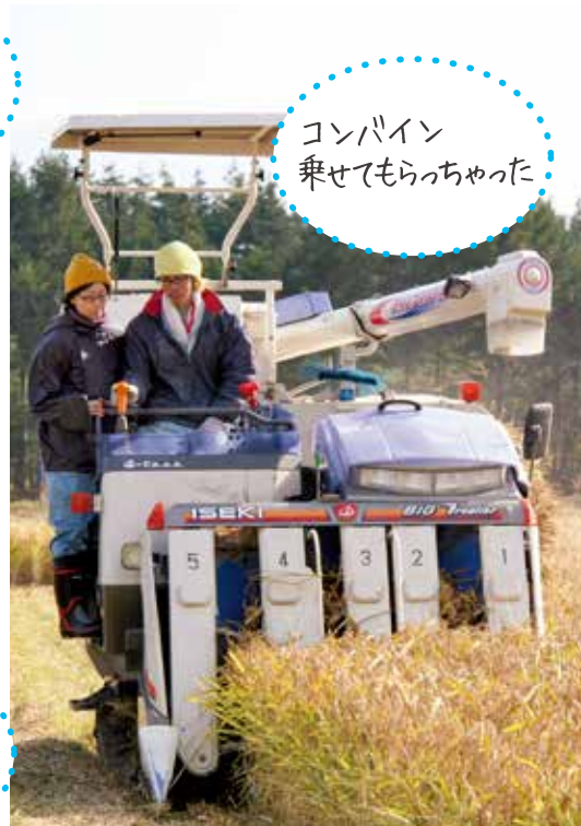
コンバイン 乗せてもらっちゃった