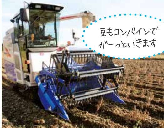
豆もコンバインで かーっといきます