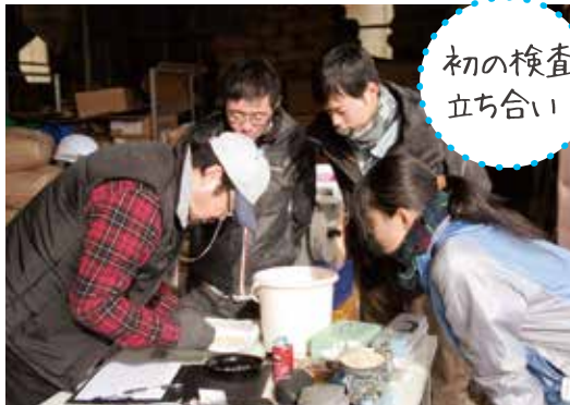
初の検査 立ち合い