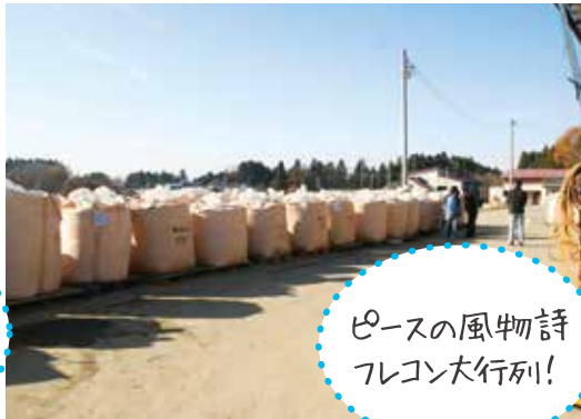
ピースの風物詩 フレコン大行列!